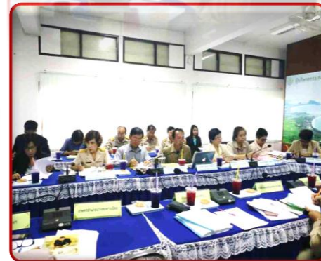
ธีระพงศ์: ข่าว

จัดทำโดย: ศูนย์ส่งเสริมเทคโนโลยีการเกษตรด้านอารักขาพืชจังหวัดสุพรรณบุรี