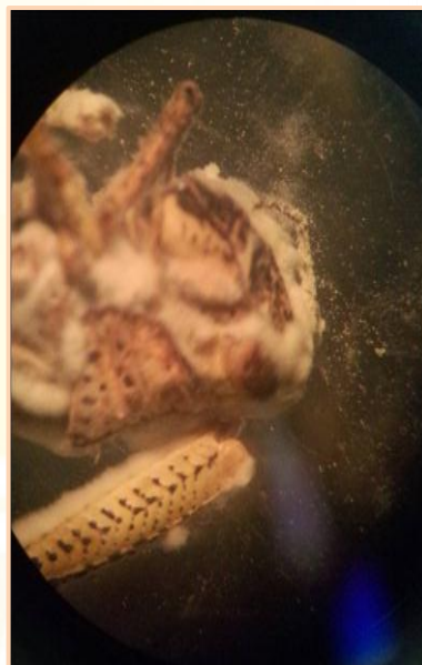
ภาพ ตั๊กแตน ไฮโรไกลฟัส, หนอนผีเสื้อข้าวสาร